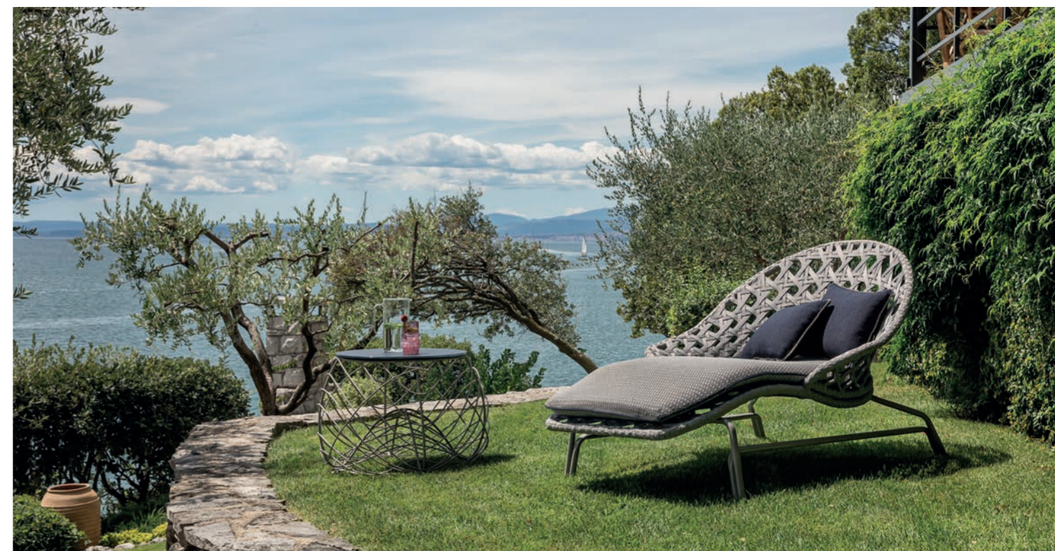
Szeźlong Evia, stół Paros

Kolekcja mebli i dodatków outdoorowych od włoskiej marki Smania zachwyci wszystkich miłośników stylowych przestrzeni