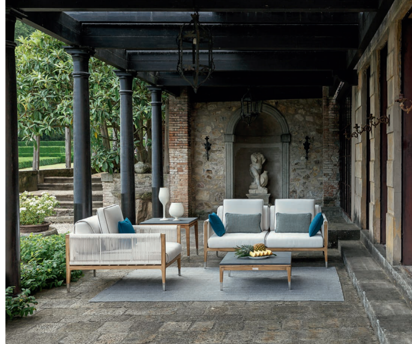
Fotel i sofa Amalfi, stoły Alghero

Dla tych, którzy lubią przebywać w ogrodzie, ale męczy ich słońce, doskonałą propozycją będą dzienne łóżka z baldachimem z linii Amalfi. Ich konstrukcja wykonana jest z teakowego drewna,