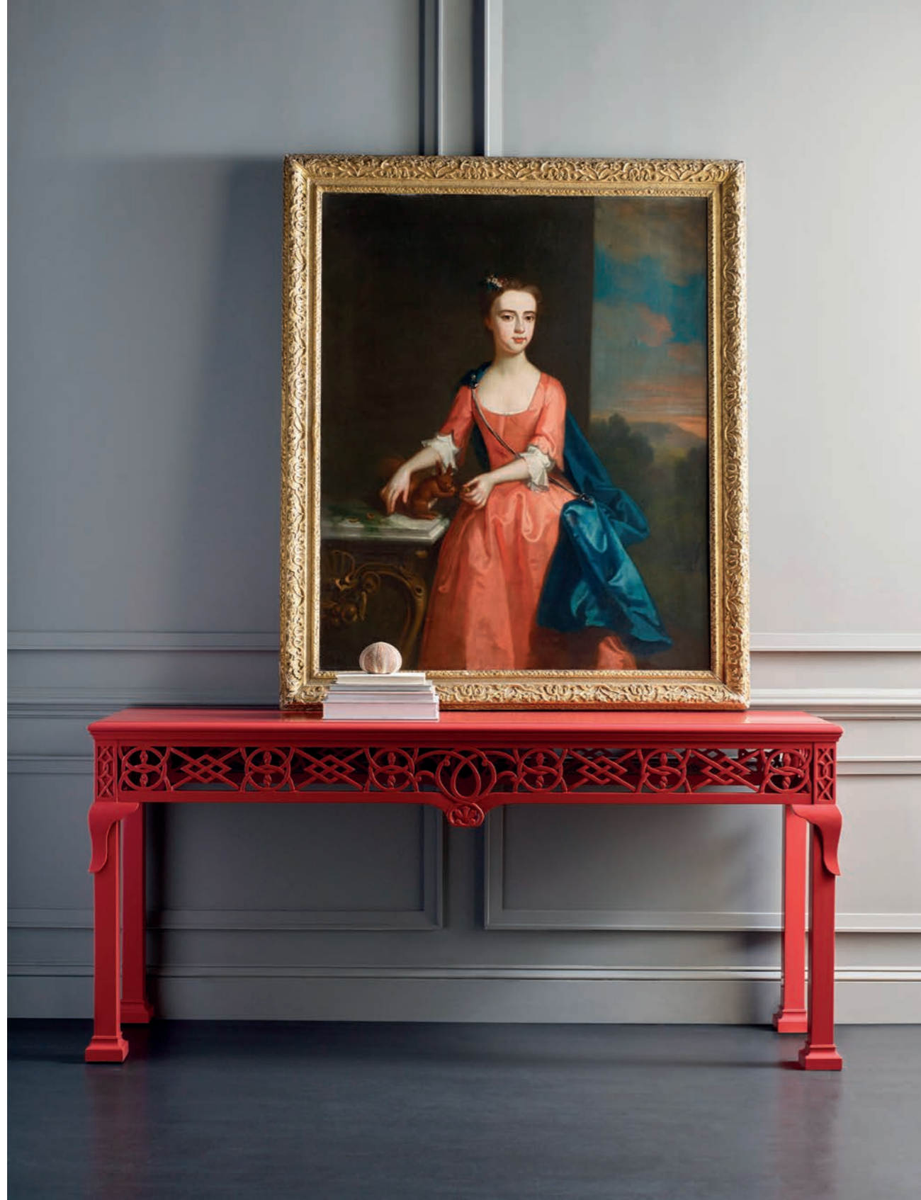
BAKER: konsola Irish Chippendale

Czasem wystarczy jeden mebel z kolekcji Stately Homes, jako cytat, by całkowicie zmienić charakter wnętrza. Z kolei dla amatorów wnętrz historycznych, którzy chcieliby przenieść klimat angielskiej rezydencji do swoich domów, możliwości są praktycznie nieograniczone.