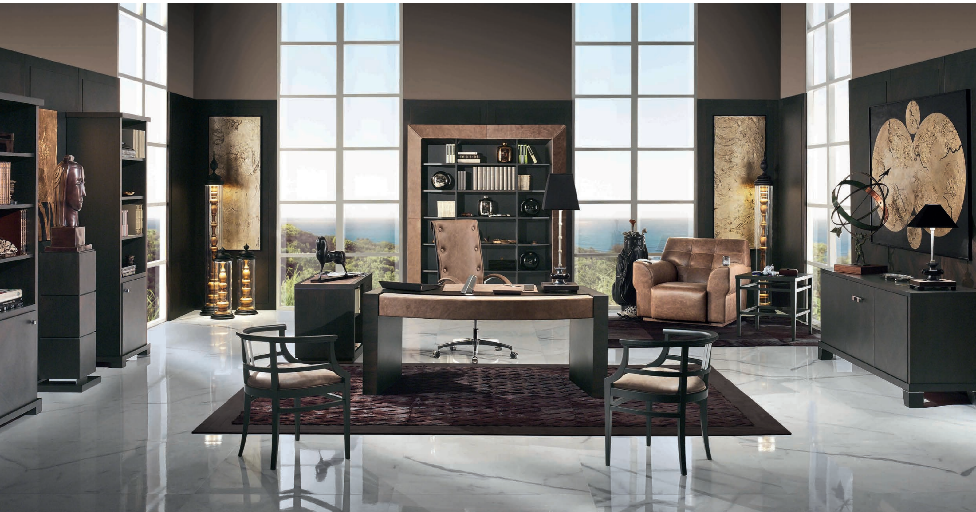
Biurko Chic, regał Anteprima Mood, krzesło City, kredens Mixer

oraz mechanizmy, które pozwalają odpocząć zmęczonym plecom. Dodatkowym atutem są najdelikatniejsze skóry używane do ich obicia. Technologia to połowa sukcesu. Drugim elementem czyniącym kolekcję biurową Smania tak wyjątkową jest design.