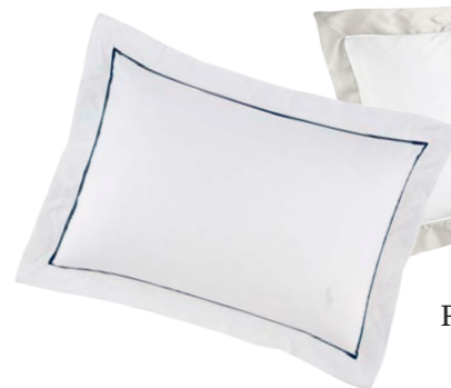
Ralph Lauren Home Poszewka na poduszkę WESTBANK