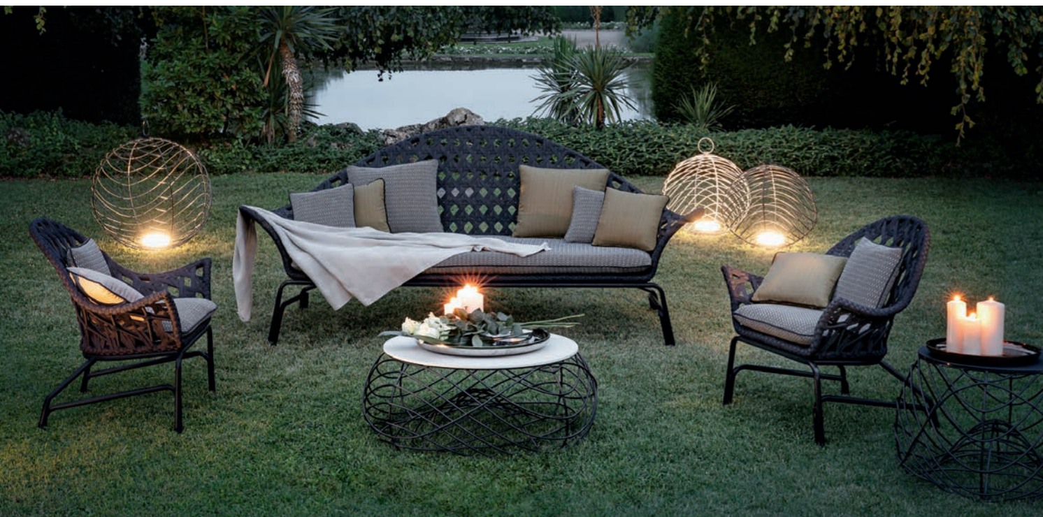
Fotele i sofa Samos, stolik Paros, lampiony Chios

Lato to także czas ucztowania na świeżym powietrzu. Długie kolacje na rozgrzanym popołudniowym słońcem tarasie wymagają zarówno odpowiedniego stołu, jak i nastrojowego oświetlenia. Bardzo elegancki teakowy stół Nettuno wprost idealnie komponuje się ze stojącym lampionem Marrakesh. Z kolei linia Giglio i Lipari koresponduje z dodatkami Casablanca.