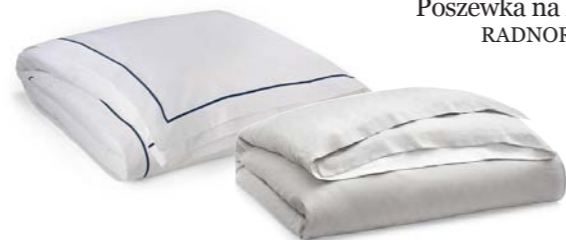
Ralph Lauren Home Poszewka na koldrę RADNOR