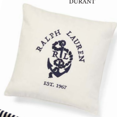
Ralph Lauren Home Poszewka na poduszkę Lucille Cream z kolekcji DURANT