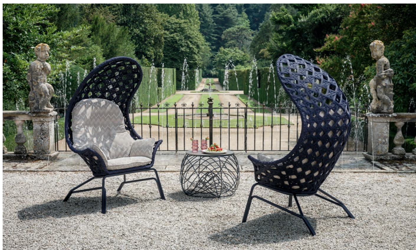
Fotele Hydra, stolik Paros

a biały len bardzo dobrze odbija promienie słoneczne.