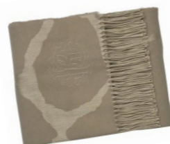
Roberto Cavalli Home Koc JEREPAH-BEIGE