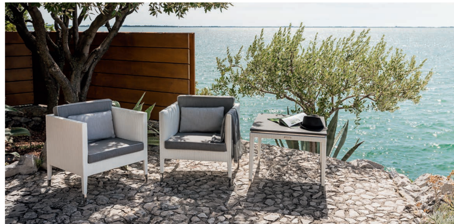
Fotele Palau, stół Capri

Jasne teakowe drewno, aluminium, szkło oraz tkaniny w naturalnych odcieniach – oto lista materiałów użytych w kolekcji.