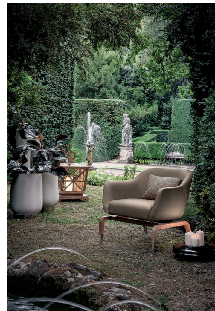
Fotel Figi, lampion Marrakesh, osłonki na kwiaty Cook