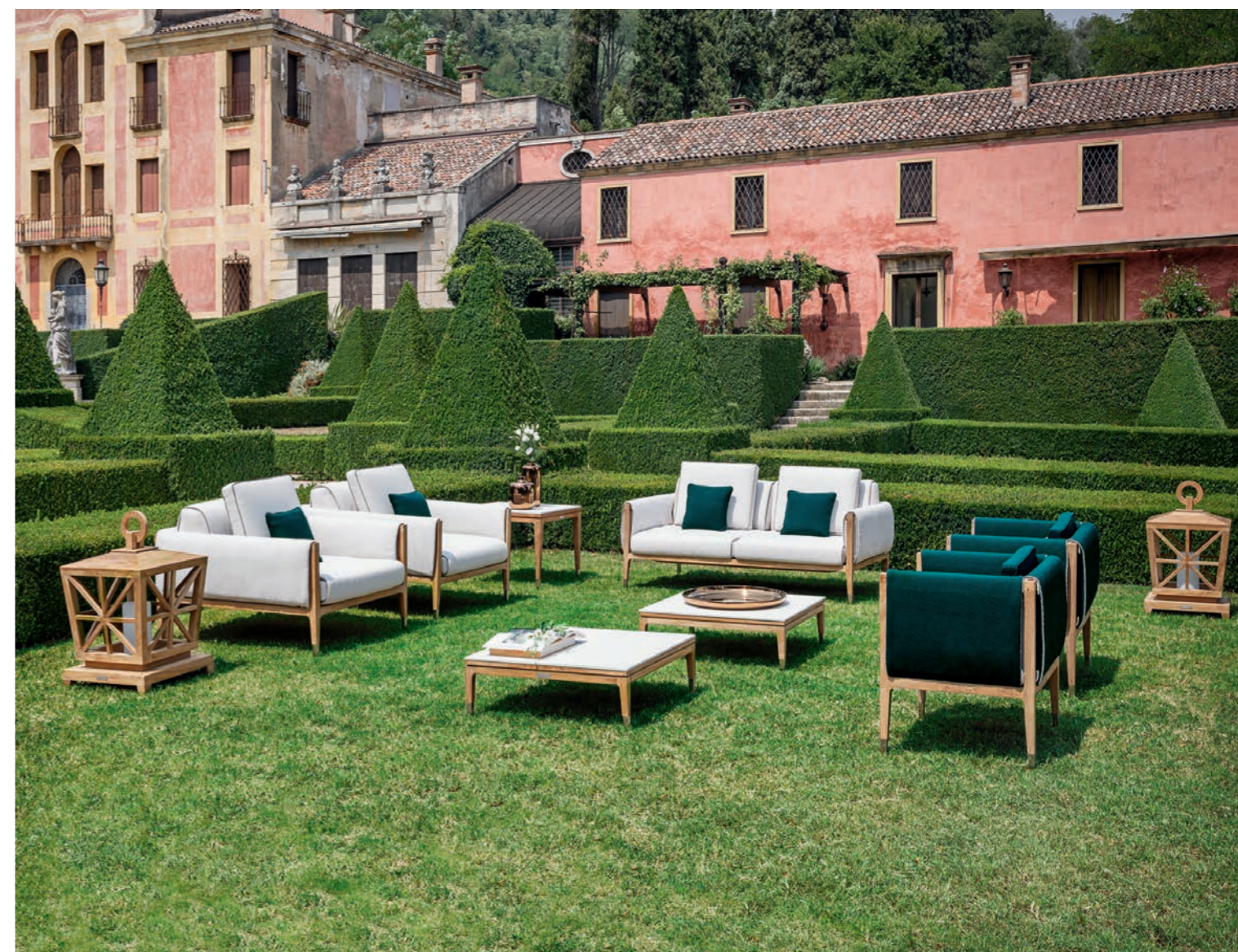
Fotele i sofa Amalfi, stoliki Capri, lampiony Marrakesh