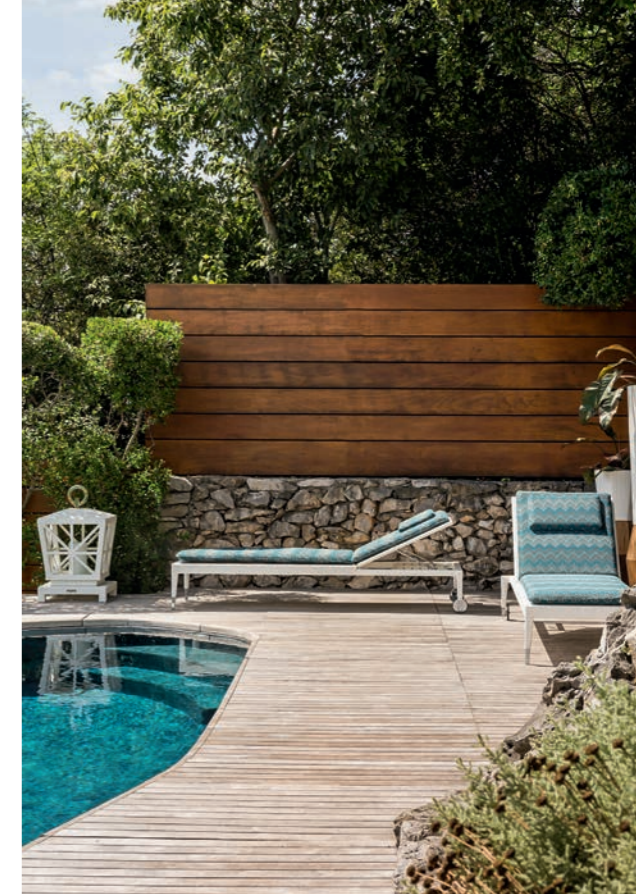
Szezlong Raphael, lampion Casablanca

Bardzo bogata kolekcja, składająca się z kilku linii pozwoli na zaaranżowanie tarasu czy przestrzeni przy basenie w stylu południowowłoskim. Głównym źródłem inspiracji były jachty pływające wokół Capri oraz cumujące u Wybrzeża Amalfi.