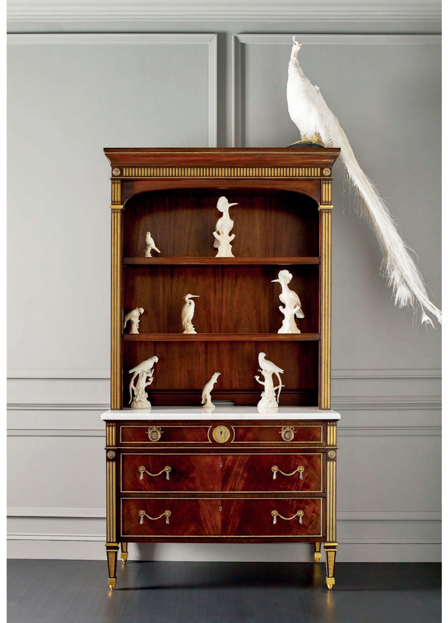
BAKER: regał Royal German

antyków jest ograniczona i nie każdy może pozwolić sobie na zakup mebli z czasów dynastii hanowerskiej czy też kabinetu z chińskiej laki. Wakefield postanowił odtworzyć najlepsze przykłady angielskiej ebenistyki w oparciu o tradycyjne techniki oraz najlepszej jakości materiały. Tak powstałe meble weszły do kolekcji Stately Homes Baker Furniture. Obejmuje ona przykłady od początku XVII wieku aż po epokę wiktoriańską.