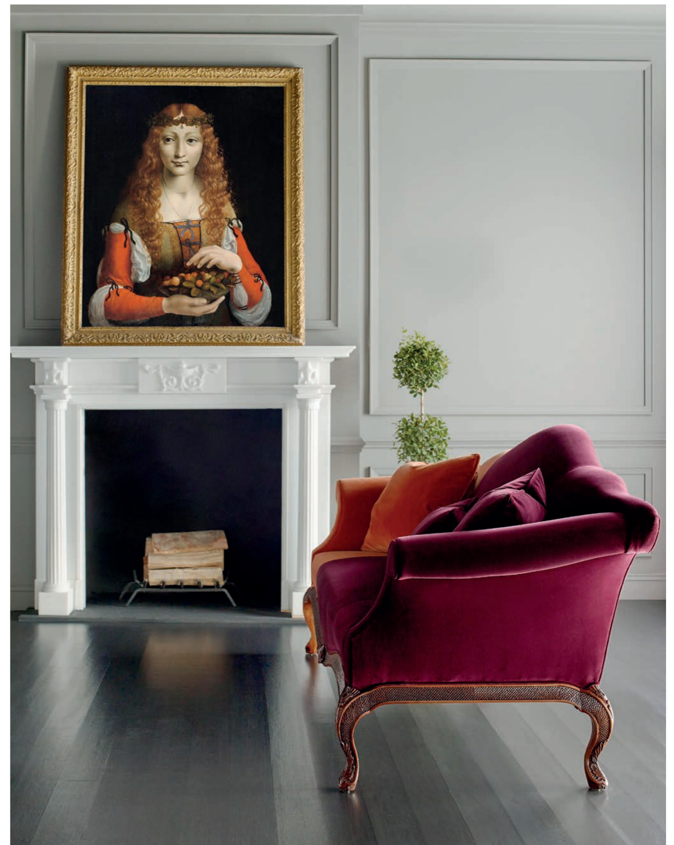
BAKER: sofa King George III

Salon Archidzielo, jako jedyny w Polsce ma przyjemność sprowadzania tych wyjątkowych mebli.