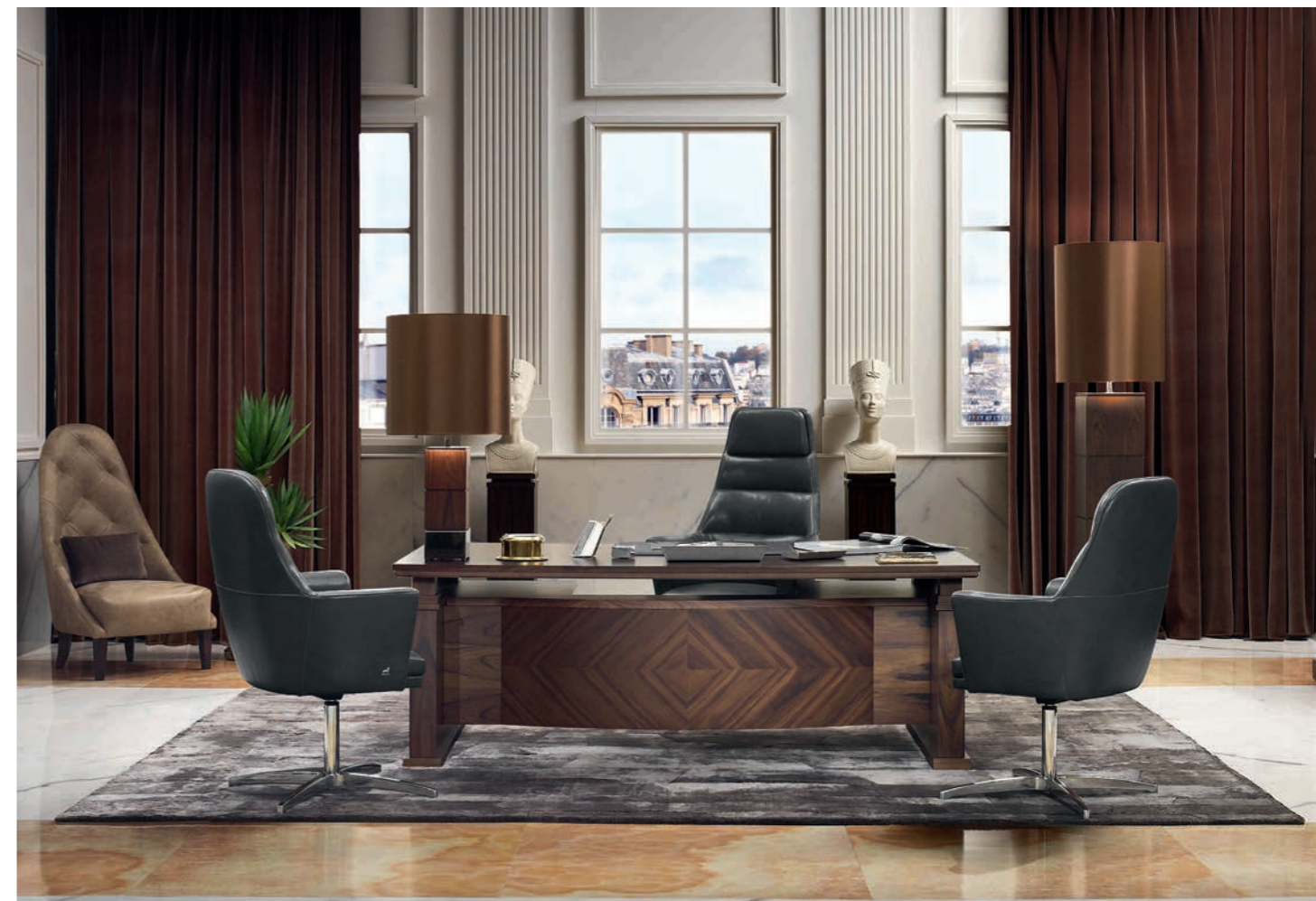
Biurko Madison, krzesła Panama