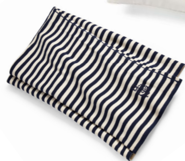
Ralph Lauren Home Koc Colleen Navy z kolekcji DURANT