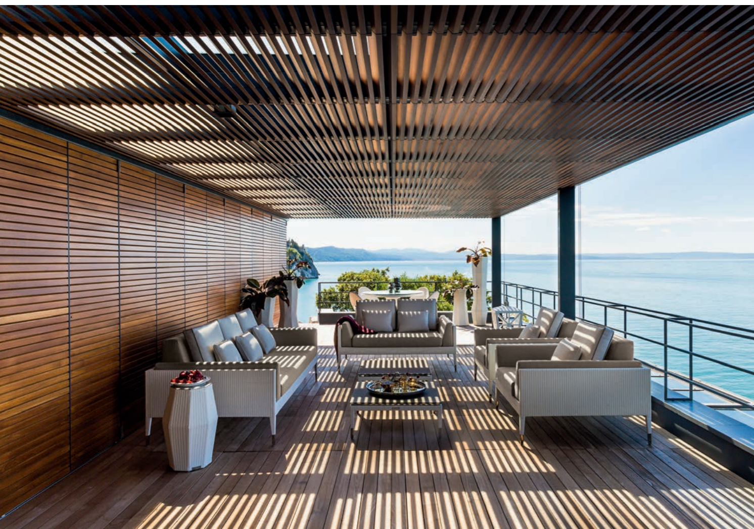
Fotele i sofa Maratea, stolik Capri, osłonki na kwiaty Cachepot

O domu nie powinno się myśleć wyłącznie w kategorii bryły i wnętrza. To także przestrzeń, która go otacza. Warto zadbać, aby była to spójna całość, a to co w środku harmonijnie korespondowało z tym, co na zewnątrz.