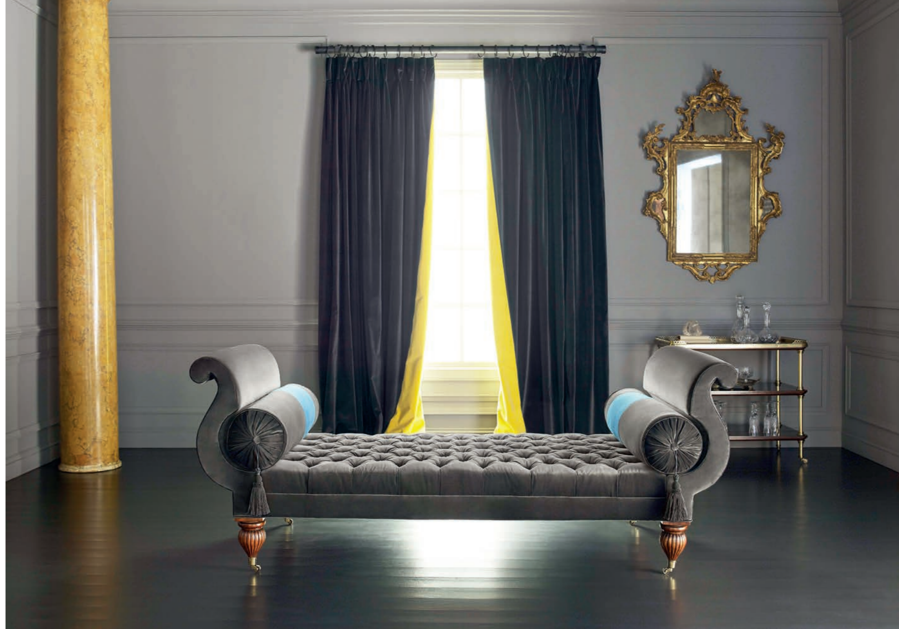
BAKER: ława King William IV