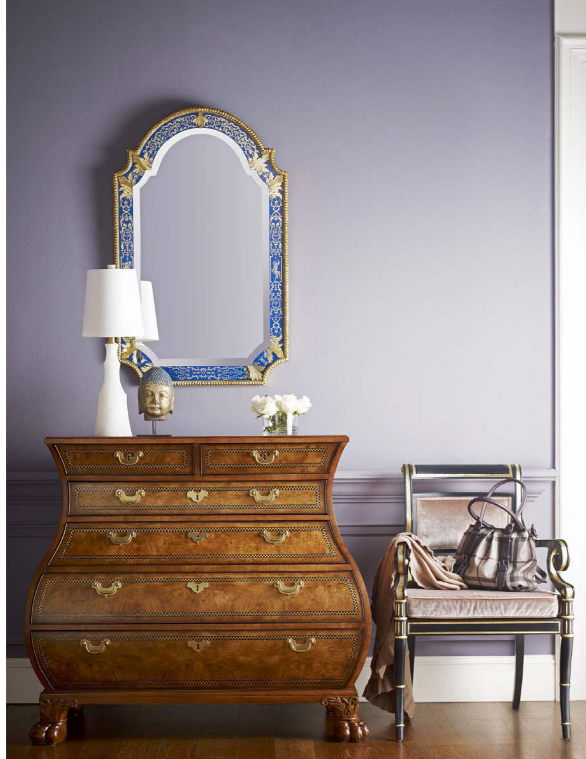
BAKER: komoda Bombe, lustro William & Mary

Jego przytulny charakter nasuwa przyjemne skojarzenia bezpiecznego, wygodnego, dostatniego domu.